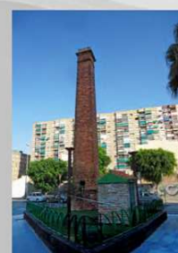
FUNDICIÓN CAYETANO RAMÍREZ Y PEDROSA